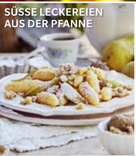
SÜSSE LECKEREIEN AUS DER PFANNE