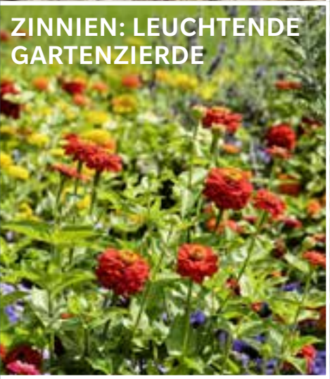
ZINNIEN: LEUCHTENDE GARTENZIERDE