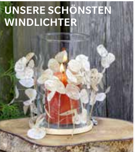
UNSERE SCHÖNSTEN WINDLICHTER